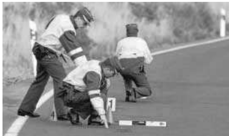
Agentes de la Guardia Civil de Tráfico investigan las causas de un siniestro.

porque son tres los heridos en la colisión que provocó su tropelía, un extremo menos habitual que lo convierte en delito y cuya pena de cárcel oscila entre seis meses y dos años, además de la privación del derecho a conducir vehículos por tiempo superior a uno y hasta seis años. El artículo 380 del Código Penal incrementa la condena de dos a cinco años y la retirada del permiso de seis a diez años si esa acción temeraria supone además un desprecio por la vida de otras personas. Ocurrió, por ejemplo, en febrero del pasado año cuando un conductor marroquí de 34 años