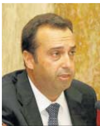
DIARIO DE ALMERÍA José María Méndez.

sentencias por delitos contra la seguridad del tráfico aparecen recogidas en la última memoria de la Fiscalía de Almería, siendo la mayoría por conducir bajo los efectos de alcohol y drogas