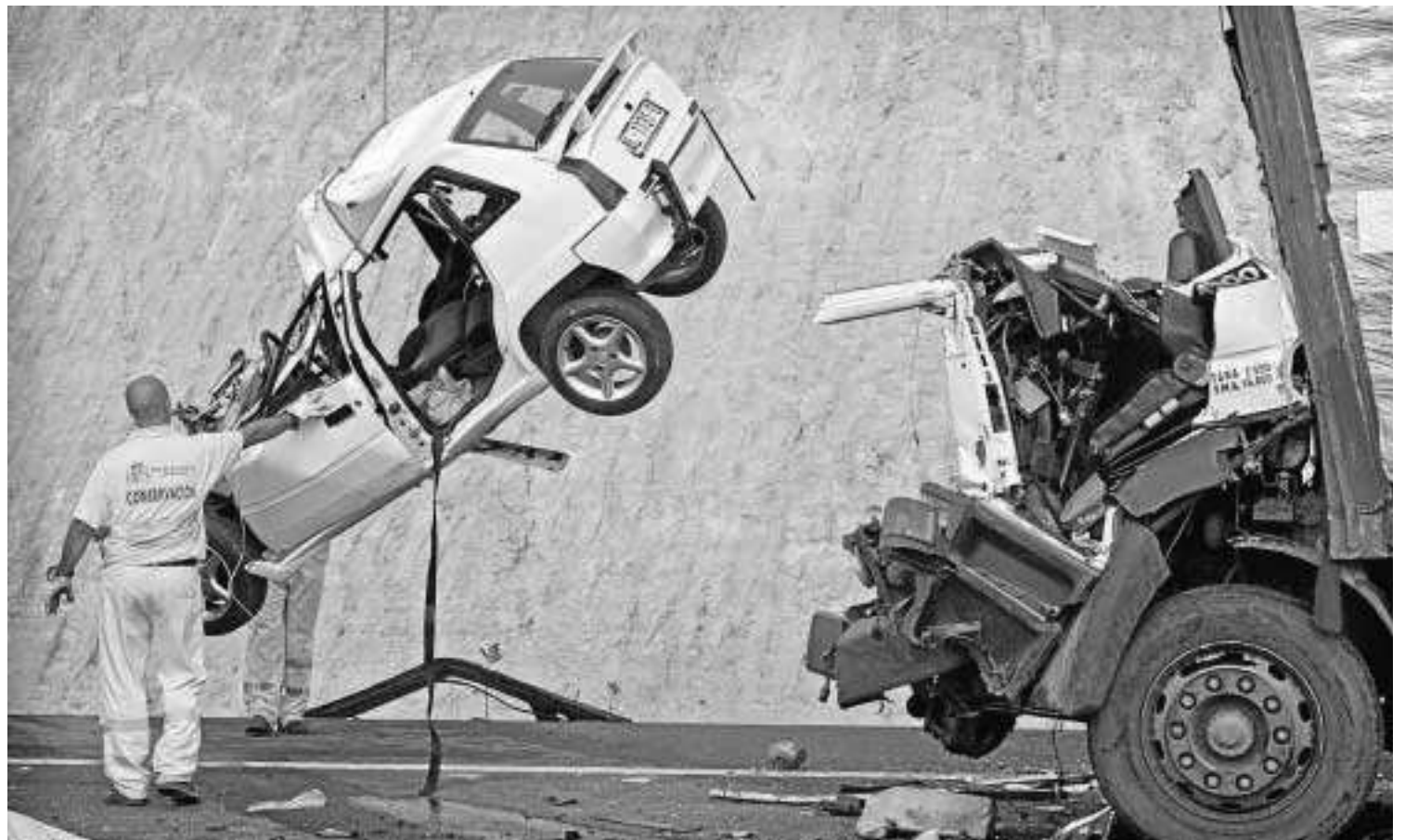
Operarios retiran dos vehículos siniestrados en un accidente que se produjo en Autovía del Mediterráneo a la altura de Huércal de Almería.

más común de lo que parece. Ese tipo de maniobra derivada de una mala interpretación o percepción de las señales, una equivocación de riego más frecuente en la tercera edad por pérdida de condiciones psicofísicas, está detrás de buena parte de las denuncias formuladas por los agentes de la Guardia Civil y policías locales por conducción temeraria que se castigan con una infracción administrativa muy grave que implica la pérdida de seis puntos y sanción económica de 500 euros, siempre y cuando no se ponga en peligro la integridad y vida de otras personas. En el caso del conductor de avanzada edad el proceso ha derivado a la vía penal