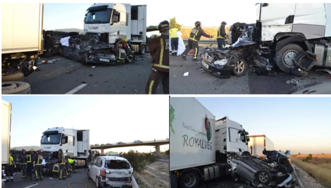
Imágenes del atestado de la Guardia Civil sobre el siniestro vial múltiple ocurrido en la A-7 por culpa del chófer de un camión que dio positivo en cocaína.