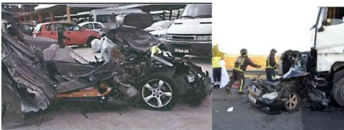
Imagen del siniestro ocurrido en la A-7, el lunes 9 de octubre de 2017, en el que el conductor de un camión que dio positivo en cocaína tras una colisión múltiple en la que murieron cinco personas, a la altura del área de descanso La Paz en Murcia.

La cruzada de este abogado murciano es compartida por otros relevantes miembros de la judicatura española. Prueba de ello es el título del artículo publicado por Vicente Magro Servet, magistrado del Tribunal Supremo , a través de la ONG Stop Accidentes : 'Hacia el nuevo delito de homicidio vial por concurrencia de alcohol y drogas en la conducción'. Servet avala la necesidad de cambiar el homicidio imprudente con el que se califican estos siniestros al volante, por el homicidio vial, para que se considere como un delito doloso y que se eleve la actual horquilla de las condenas, de 2 años a 4 años, hasta los 10 años del modelo francés.