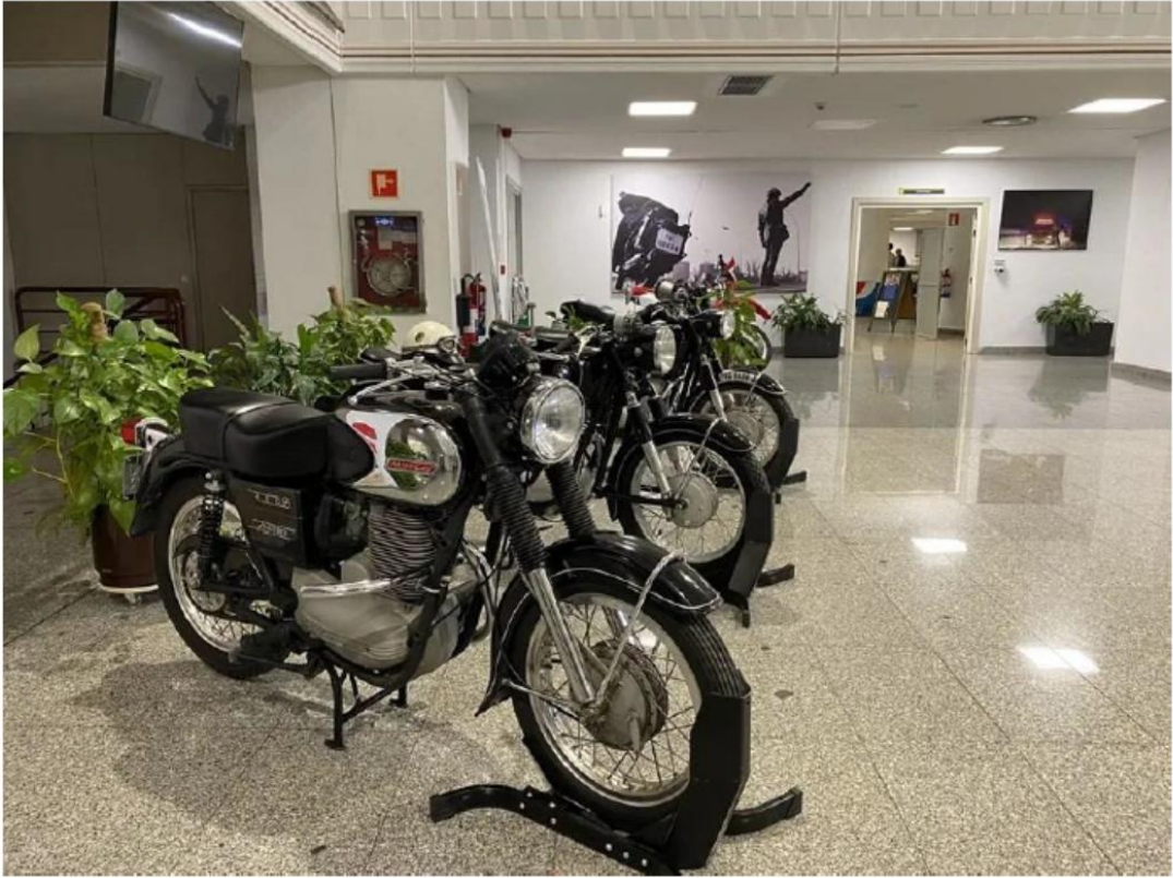
Vestíbulo de la ATGC, donde se exponen algunos de los vehículos históricos que han formado parte del cuerpo.