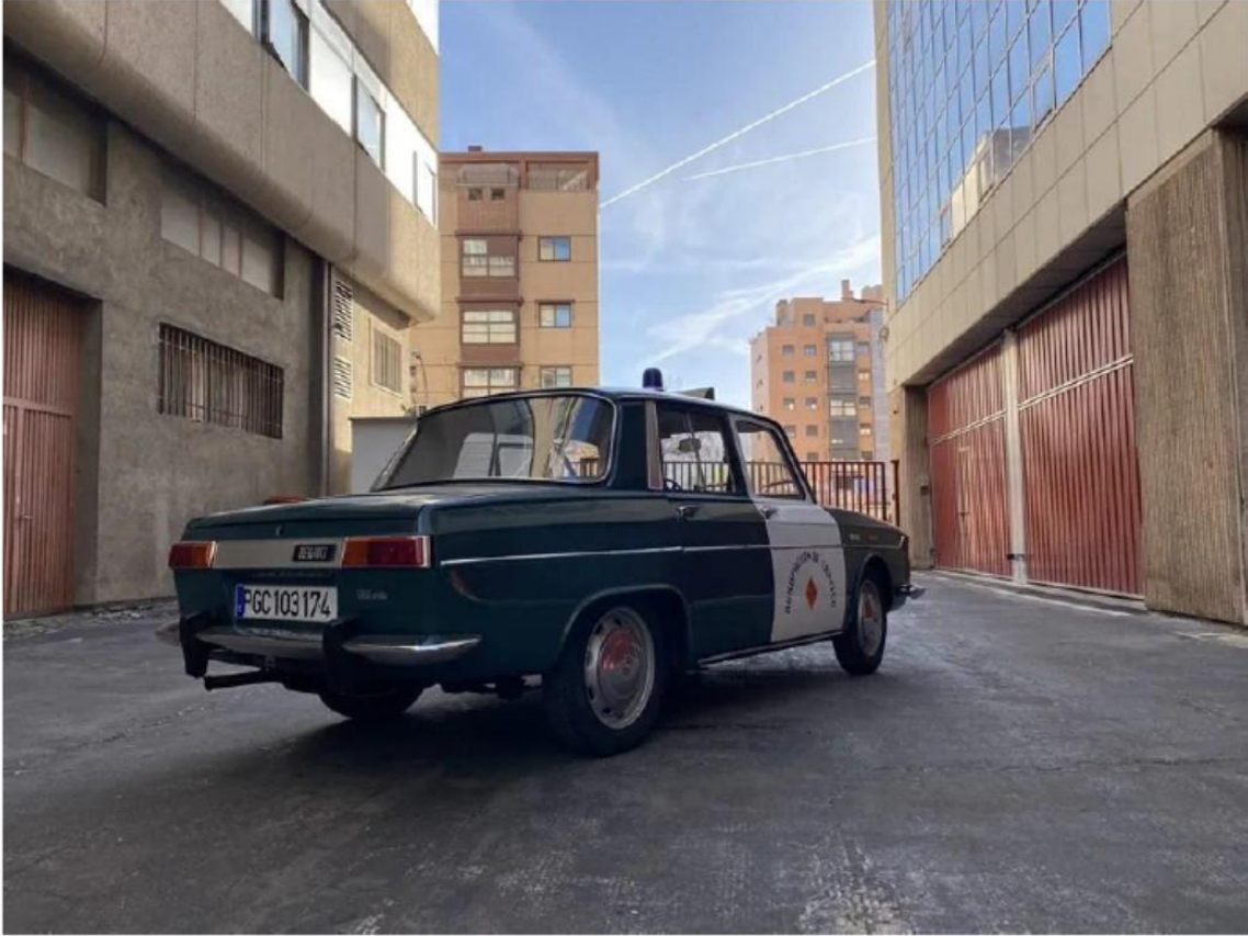
Vehículo de la Guardia Civil expuesto en la ATGC.