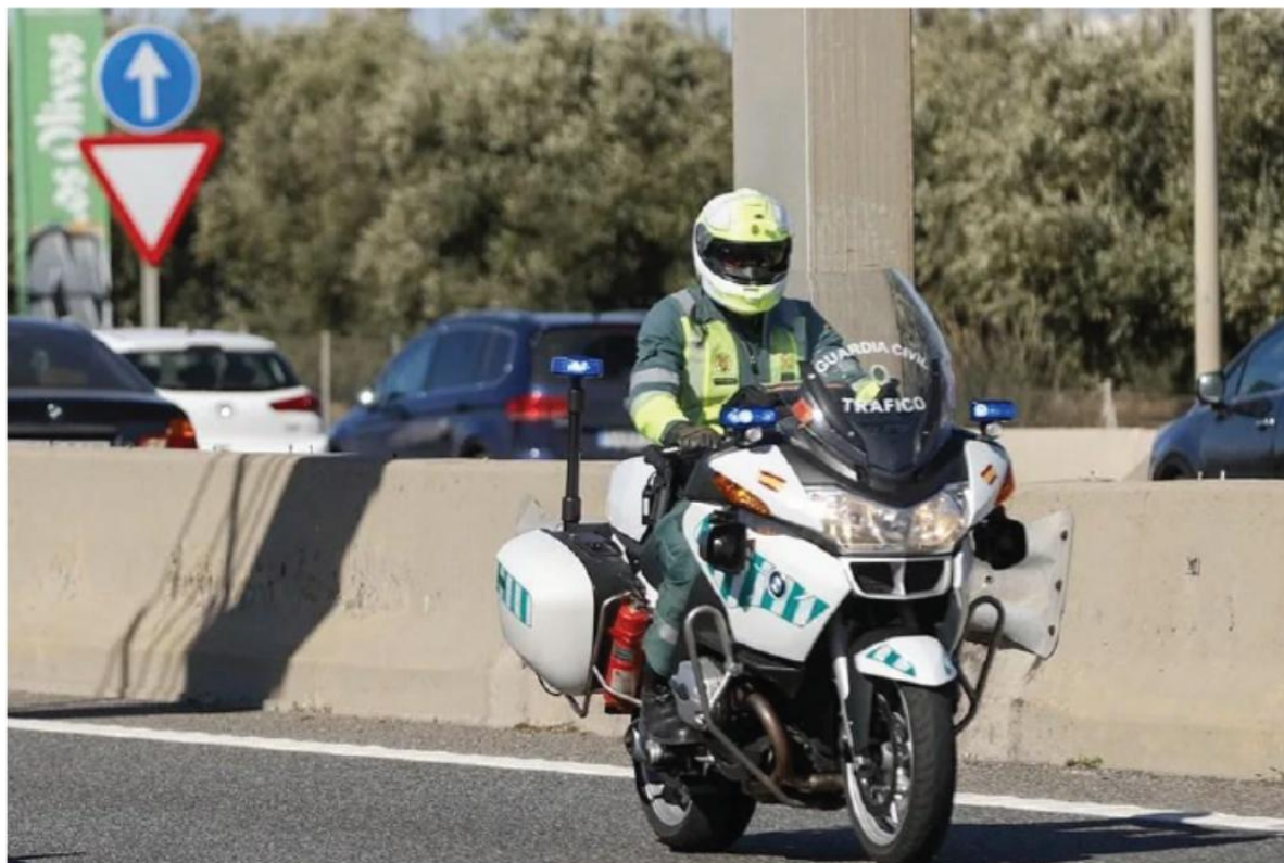
Un agente de la Guardia Civil de Tráfico en una imagen de archivo.