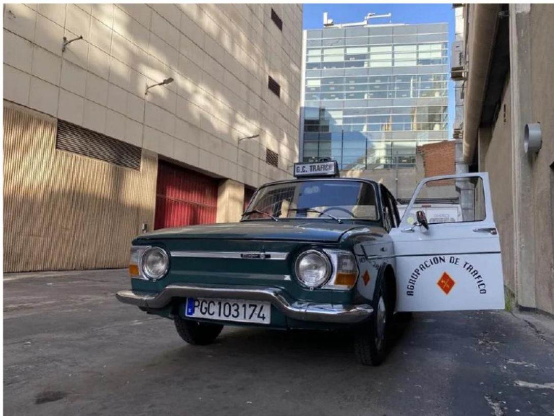
Uno de los vehículos expuestos en la ATGC.

Desde el R-10, la evolución en los coches ha sido constante. Las carreteras del país han visto circular a guardias civiles en vehículos desde el Peugeot 407 o el Alfa Romeo 159 hasta el reciente BMW X3, un híbrido todoterreno. Hoy, la flota de la Agrupación está compuesta por 2.100 coches y 2.200 motocicletas, con los que se han recorrido 7.868 millones de kilómetros, según datos cerrados a 31 de diciembre de 2024.