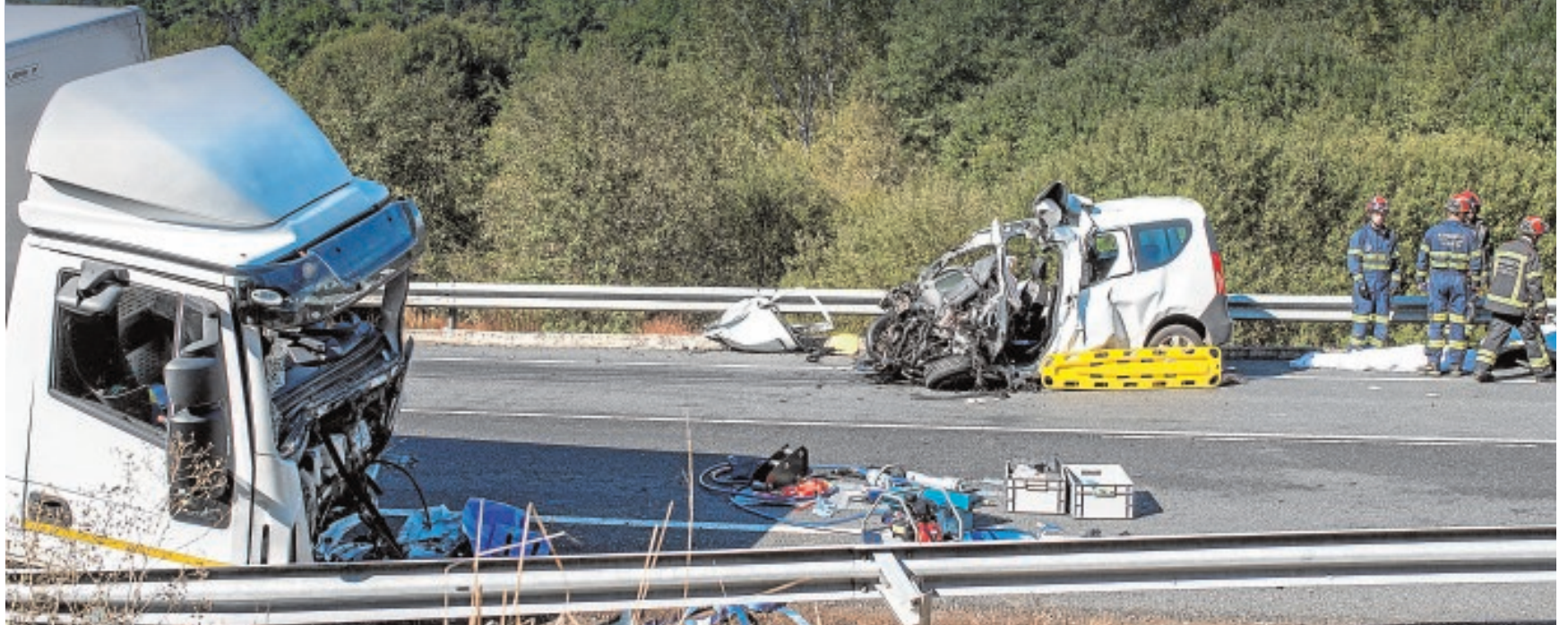
Una persona murió y otra resultó herida grave en una colisión entre una furgoneta y un camión el pasado 16 de octubre, en San Cristovo de Cea (Orense)